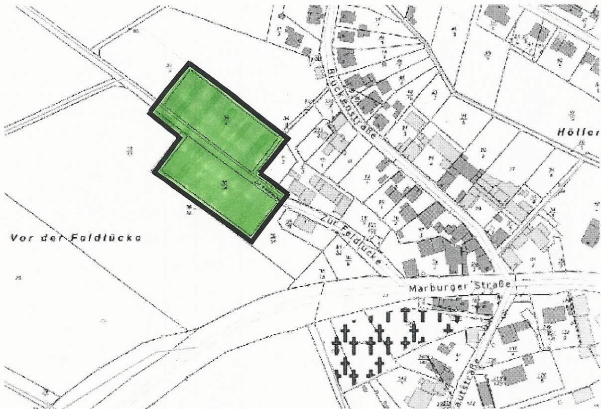
Fläche für die Landwirtschaft, ohne Maßstab