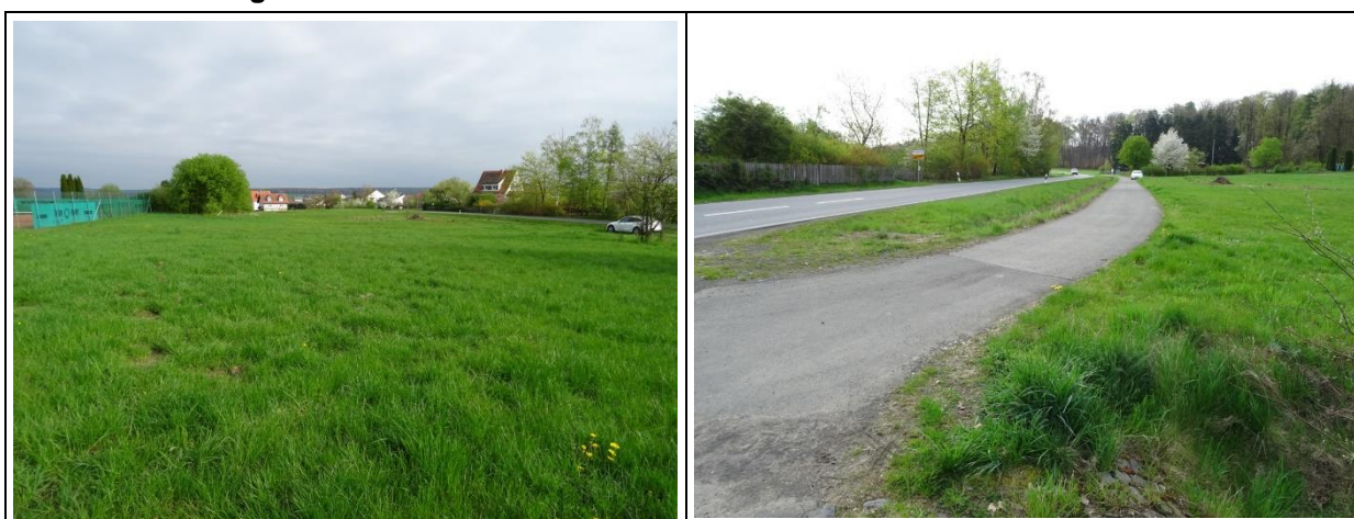
Eigene Aufnahmen (04/2024)

Der Bereich des Plangebietes ist topografisch weitgehend eben und bewegt sich auf einem Höhenniveau zwischen rd. 308 m über Normalhöhennull (ü.NHN) im Norden und rd. 310 m ü.NHN im Süden.