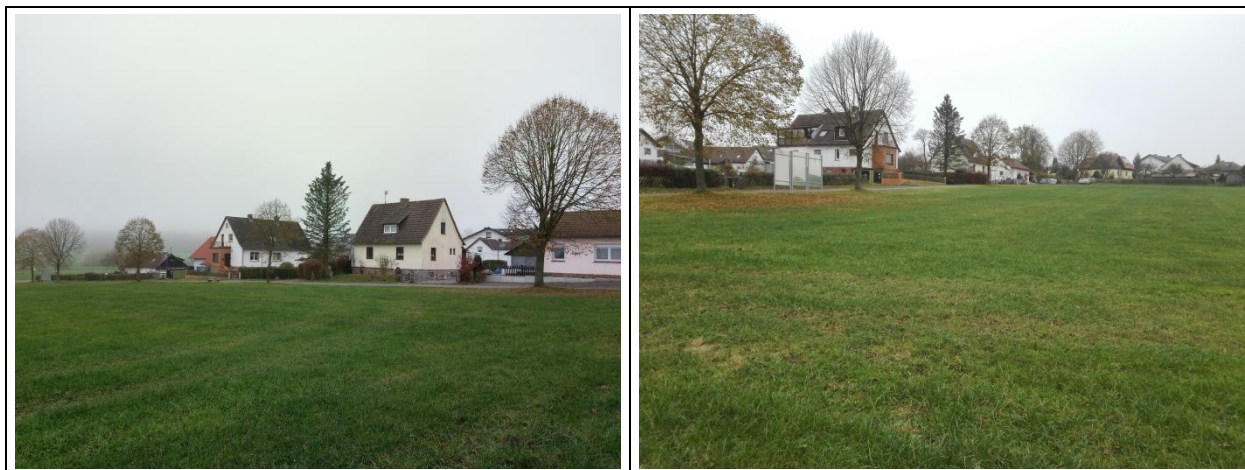
Eigene Aufnahmen (11/2017)