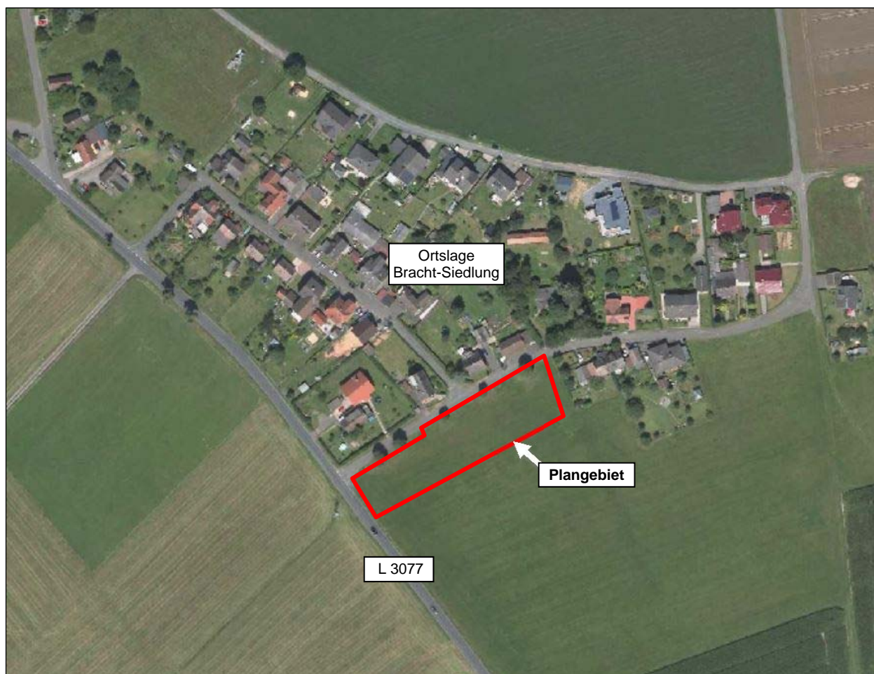
Abbildung genordet, ohne Maßstab

Das Planziel des Bebauungsplanes ist die Ausweisung eines Mischgebietes i.S.d. § 6 Baunutzungsverordnung (BauNVO), um den Anforderungen der im ländlichen Raum häufig vorzufindenden und auch im Bereich des vorliegenden Plangebietes angestrebten Durchmischung von Wohnen und nicht störendem Gewerbe gerecht zu werden. Zur Wahrung einer geordneten städtebaulichen Entwicklung werden darüber hinaus unter anderem Festsetzungen zum Maß der baulichen Nutzung, zur Bauweise und zu den überbaubaren Grundstücksflächen getroffen sowie bauordnungsrechtliche Gestaltungsvorschriften formuliert. Hinzu kommen Festsetzungen zur grünordnerischen Gestaltung und Eingriffsminimierung sowie die Regelung des naturschutzrechtlichen Ausgleichs. Der Flächennutzungsplan der Stadt Rauschenberg stellt für den Bereich des Plangebietes bislang „Flächen für die Landwirtschaft“ dar und wird daher gemäß § 8 Abs. 3 Satz 1 BauGB im Parallelverfahren zur Aufstellung des Bebauungsplanes geändert.