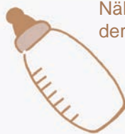
Nähren mit der Flasche

Aktuelle Termine erfahren Sie auf der Homepage www.rauschenberg.de und in den Rauschenberger Nachrichten.