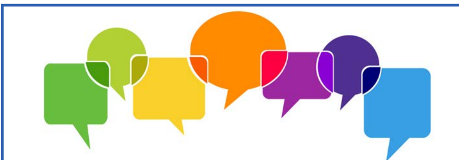
Bild: Vielstimmigkeit und Gesprächsplattformen — Wie können Jugendliche besser einbezogen werden?

Mehr Informationen und kommende Veranstaltungen unter: www.mein-marburg-biedenkopf.de