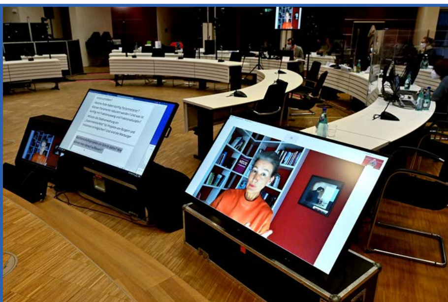
Bild: Ein Blick hinter die Kulissen bei der digitalen Veranstaltung

Der Landkreis Marburg-Biedenkopf war Gastgeber der digitalen Jahrestagung der Allianz Vielfältige Demokratie. Die Mitglieder des Netzwerkes tauschten sich über die Chancen und Herausforderungen digitaler Bürgerbeteiligung sowie über Open Government aus. Der Kreis engagiert sich seit 2015 in der Allianz Vielfältige Demokratie, die als freiwilliger Zusammenschluss von Vertreter*innen von Verwaltungen, der Politik sowie zivilgesellschaftlichen Organisationen das Thema Bürgerbeteiligung, insbesondere im Hinblick auf Demokratieentwicklung, voranbringen.