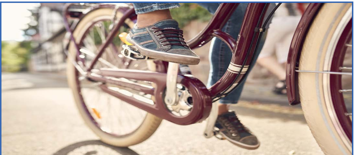
Bild: Symbolbild Radverkehr

Eine Dokumentation der digitalen Konferenz vom 25. März 2021 sowie mehr Informationen finden Sie bereits jetzt unter www.mein-marburg-biedenkopf.de . Hier wird ebenso rechtzeitig auf die kommenden öffentlichen Termine hingewiesen dazu eingeladen.