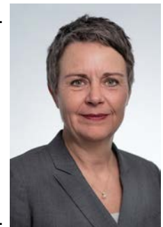
Landrätin Kirsten Fründt

Und nun schauen wir, welche Möglichkeiten uns das nächste Halbjahr bietet. Sehr gerne werden wir uns wieder persönlich mit Ihnen treffen und beides, digital und analog, sinnvoll miteinander verbinden.