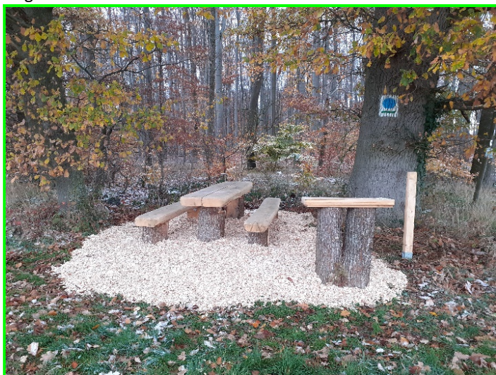
„Ort der Stille“ am Waldrand

Als „Europäische Kulturroute“ führt der Hugenotten- und Waldenserpfad auch durch das Marburger Land und macht auf seinem weiteren Weg auch im „Daniel-Martin-Haus“, dem weithin bekannten Schwabendorfer Dorfmuseum Halt. Von dort führt der Weg schließlich hinein in den Burgwald und vereint sich nach der Passage der „Franzosenwiesen“ auf dem Christenberg mit dem Hauptweg. Seinen Beginn hat der Weg in Südfrankreich am Mittelmeer, führt hinauf über die frühere Dauphiné in die Schweiz, weiter nach Süddeutschland und endet in der Hugenottenstadt Bad Karlshafen in Nordhessen.