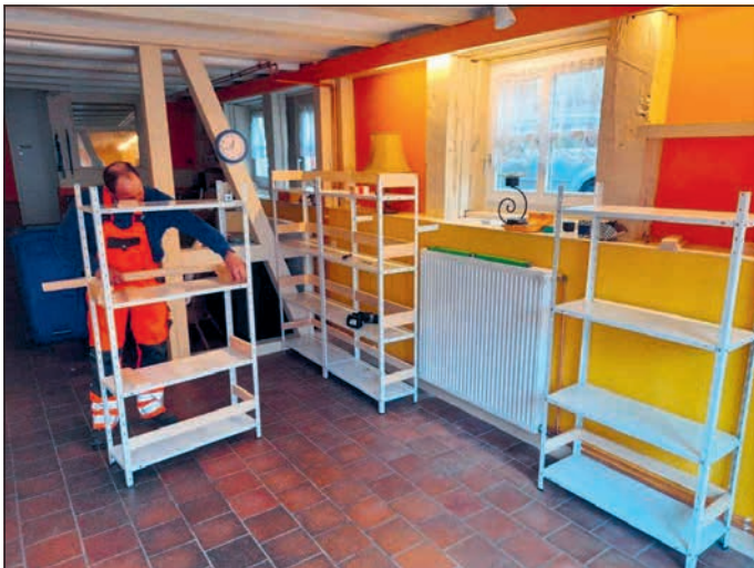
Der Bauhof hat die Regale in der Nähstube für die Büchertauschbörse vorbereitet.

Den Anfang macht Armin Köhler mit seinen Tierfotografien: Sie sind zunächst im Schau fenster zu bewundern. Sind die Arbeiten in den Räumen gänzlich abgeschlossen und kann die Näh- und Märchenstube auch coronabedingt wieder genutzt werden, wird auch eine Wand mit Fotos dekoriert. Und dann wollen Armin Köhler und Michael Blauschies auch gerne Interessierten etwas über ihre Fotos erzählen – ganz im Sinne der Näh- und Märchenstuben: Dass neben Nähen und Handarbeiten dort zusammengesessen und erzählt wird – fast wie früher in den Spinnstuben.