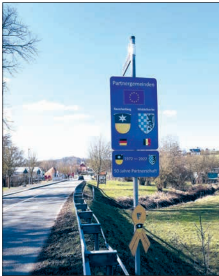
Die neuen Schilder zur Städtepartnerschaft stehen an den Ortseingängen kommend aus Schwabendorf und von der L3073.

MW im Jahr 2020 mehr als verdreifacht. Beeindruckend ist auch die Strommenge: rund 10.000 kWh je Einwohner wurden im Jahr 2020 innerhalb der Kommune von EEG-geförderten Anlagen erzeugt. Wichtigster Energieträger mit einem Anteil von nahezu drei Viertel (74 Prozent) an der installierten Leistung ist die Windenergie, die übrige Leistung teilen sich PV-Anlagen und Biomasse mit jeweils 13 Prozent.