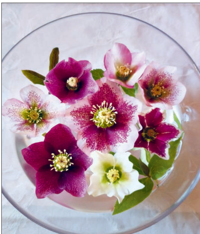
M. Henkel, E. Pienkny

Der einzige Nachteil ist vielleicht, dass die Blüten nach unten nicken, aber wenn man ein paar abschneidet und in einer Schale mit Wasser schwimmen lässt, wird ihre Schönheit sichtbar.