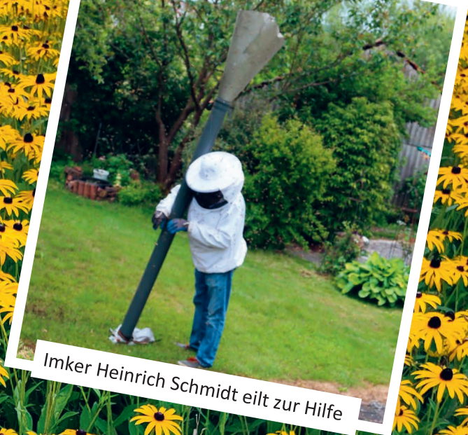
Imker Heinrich Schmidt eilt zur Hilfe

Schon nach kurzer Zeit können die Bienen sicher abtransportiert werden.