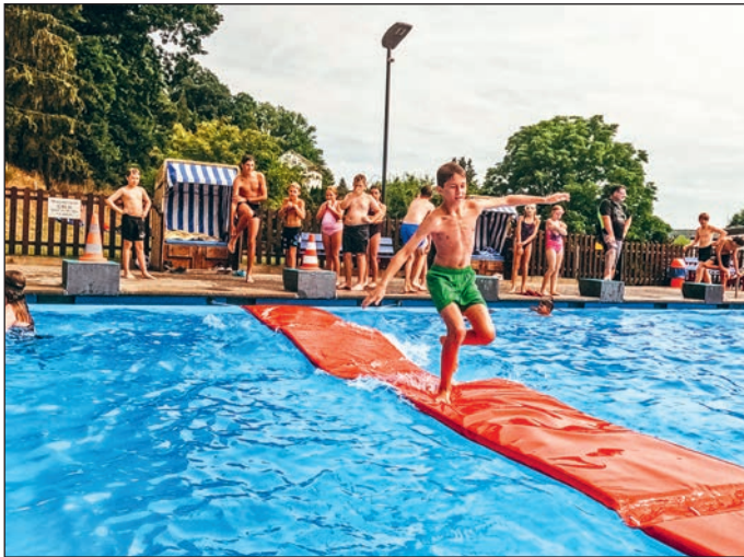
- Der Vorstand -