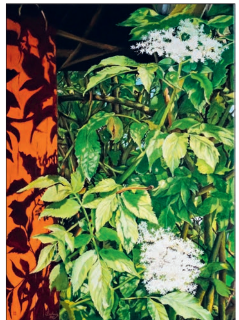
Holunder am Gartenhaus, Ölmalerei 50x70 cm

Am letzten Oktoberwochenende zeigt der Rauschenberger Bilder aus den vergangenen drei Jahren. Seine Arbeiten werden in den Räumen der Firma „Office 4 Sale“ in der Bahnhofstraße, oberhalb der Kratz'schen Scheune, präsentiert. Es handelt sich überwiegend um Gemälde in klassischer Ölmaltechnik. Die Bilder decken ein breites Spektrum an Themen ab. Neben der naturalistischen Darstellung von Blumen und Blüten,