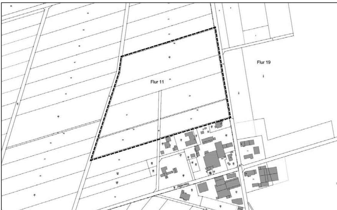
Räumlicher Geltungsbereich des Bebauungsplanes „Solarwärmezentrale Bracht-Siedlung“ sowie der Flächennutzungsplan-Änderung in diesem Bereich