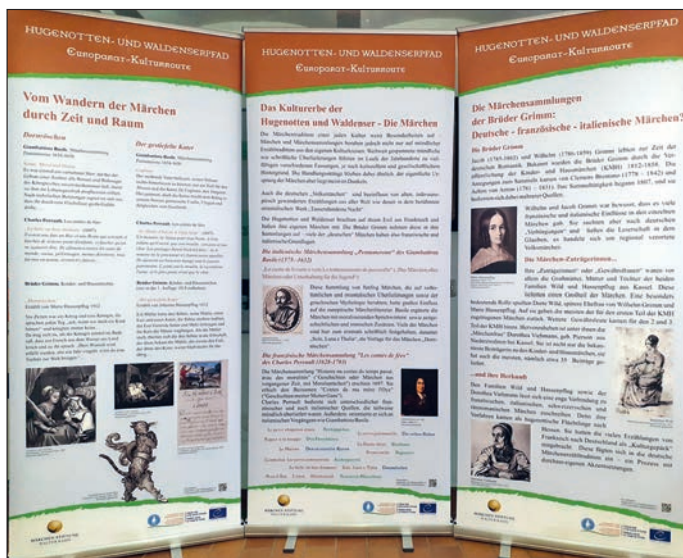
Ausstellungstafeln im Dorfmuseum (Leihgabe des Vereins Hugenotten- und Waldenserpfad e.V.)

Hierüber erfahren die Besucher*innen mehr im Daniel-Martin-Haus, dem Schwabendorfer Dorfmuseum, das nach der Winterpause am Sonntag, dem 19.03. von 14 bis 17 Uhr wieder seine Türen öffnet.