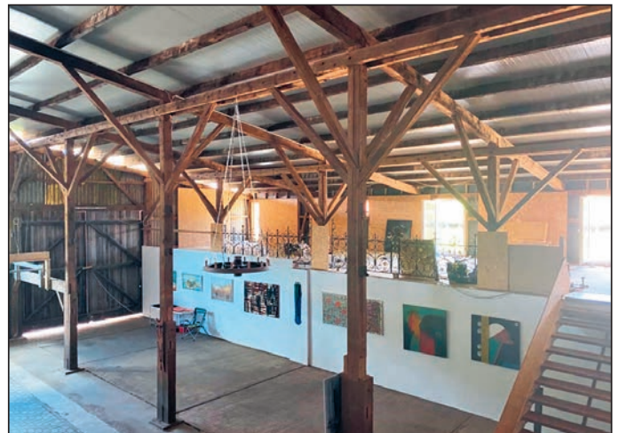
Im besonderen Ambiente des Reitsporthofes wird am Ostermontag Handwerkskunst präsentiert.

Innerhalb des Gebäudekomplexes werden in einer hohen großen attraktiven Halle mit Sichtbalken und Emporen 20 überwiegend Kunsthandwerker und einige Künstler aus der Region und schwerpunktmäßig aus dem Vogelsberg eine große und unterschiedliche Vielfalt ihrer Werke präsentieren. Die Räumlichkeiten werden wie schon 2022 von Irene Stier-Böttcher und Erich Böttcher zur Verfügung gestellt.