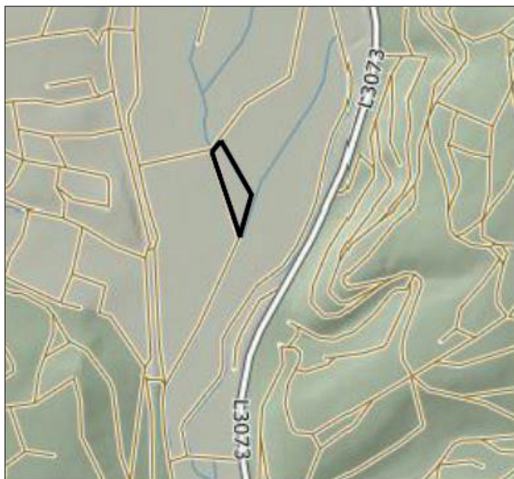
Geoportal Hessen, ohne Maßstab; Ausgleichsfläche

Gemäß § 215 BauGB wird darauf hingewiesen, dass eine nach § 214 Abs. 1 Satz 1 Nr. 1 bis 3 BauGB beachtliche Verletzung der dort bezeichneten Verfahrens- und Formvorschriften, eine unter Berücksichtigung