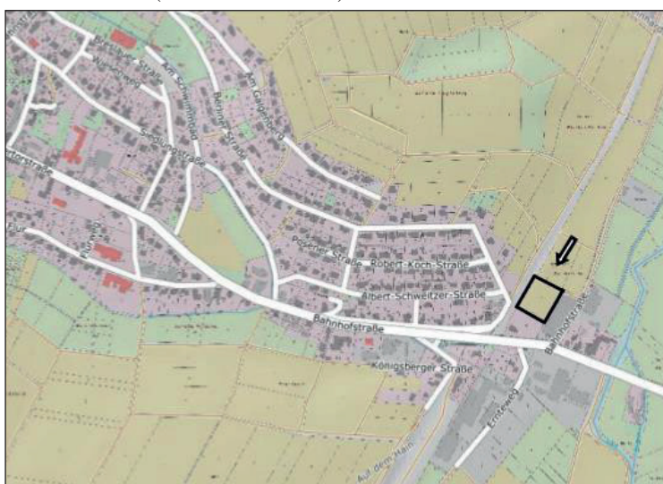
Abbildung genordet, ohne Maßstab; Baugebiet

Räumlicher Geltungsbereich des Bebauungsplanes Nr. 15 „Bei der Siechkirche II“ (Plankarten 1 und 2)