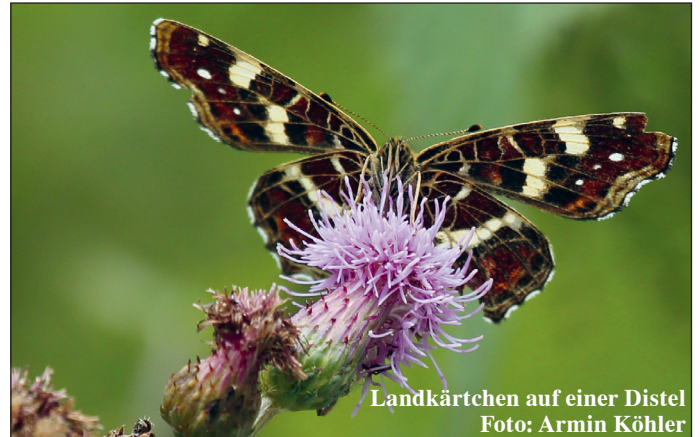
Landkärtchen auf einer Distel

Für die Fußballabteilung - Kevin Boseniuk