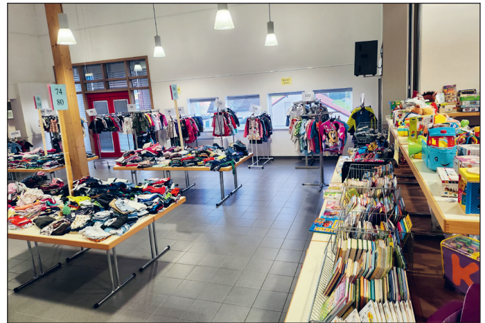
Autoren: Eva Köhler und Mira Noll

Das Team der Organisatorinnen war sehr erfreut über die gute Resonanz und die vielen positiven Rückmeldungen. Ein großes Dankeschön geht dabei an die zahlreichen freiwilligen Helferinnen und Helfer, die zusätzlich mit anpackten und ohne die eine solche gelungene Veranstaltung nicht möglich gewesen wäre! Einstimmig wurde beschlossen, den Basar nun regelmäßig stattfinden zu lassen. Der nächste Termin steht auch schon fest: Am Samstag, dem 23.09.2023 gibt es einen Herbst-/Winterbasar, dieses Mal sogar mit Teenie-Markt bis Kleidergröße 176. Weitere Informationen finden Sie unter kvr-rauschenberg.de/basar.html .