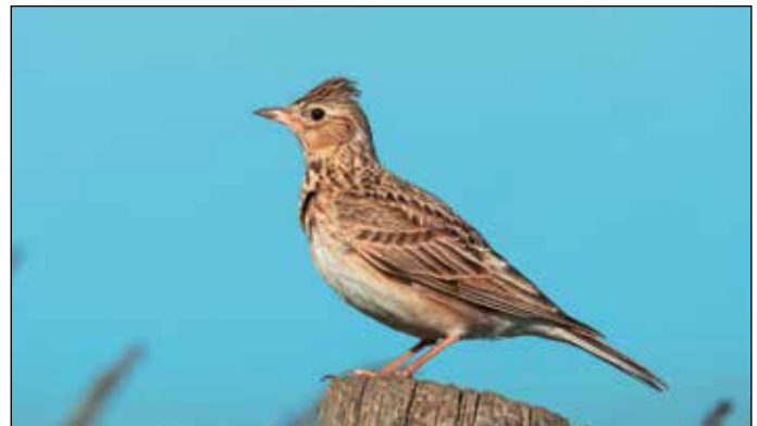
Lerche auf einem Weidepfosten