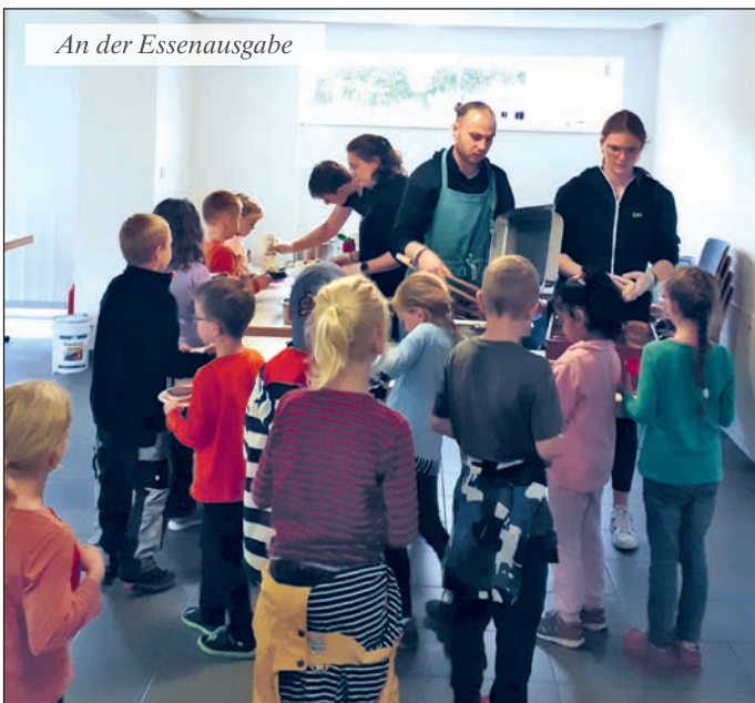
An der Essenausgabe