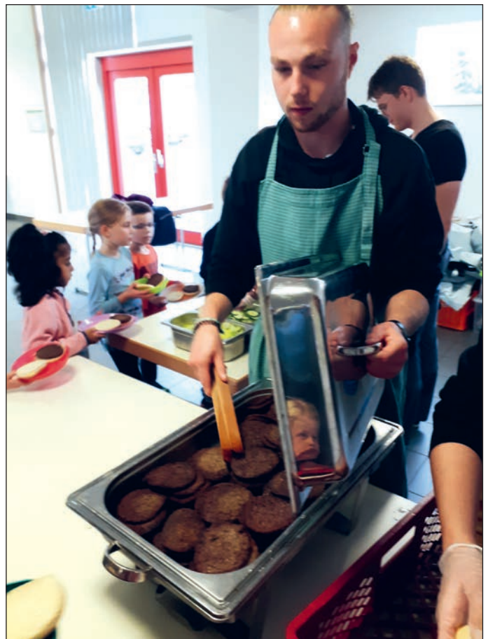
Beliebt bei Kindern und Teamern: die „Scheunen-Burger“