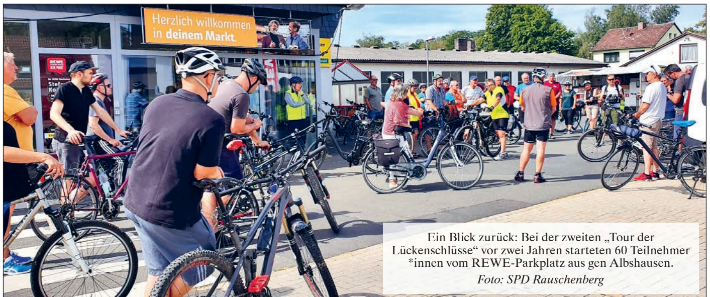
Ein Blick zurück: Bei der zweiten „Tour der Lückenschlüsse“ vor zwei Jahren starteten 60 Teilnehmer*innen vom REWE-Parkplatz aus gen Albshausen.