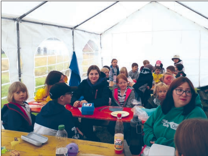
„Gleich gibt es Mittagessen“

Rund 100 Kinder beteiligten sich an dem Freizeitangebot in der 2. Ferienwoche und ließen sich von dem wenig sommerlichen Wetter nicht die Laune verderben.