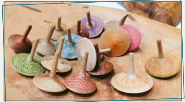
Kunstvoll-bunte Kreisel aus Holz (Foto Ansicht Holzarbeiten Hans-Werner Henkel)

Feine Edelstahlobjekte, Skulpturen, Leuchtobjekte und Lichtdesign, Objektgestaltung oder Kunstwerke aus Holz, Schiefer und Glas gehören zum großen Angebotsspektrum. Aber auch Seifen und Badeporalinen werden zu kleinen Kunstwerken verarbeitet und dienen so als schönes Geschenk oder zum Eigengebrauch.