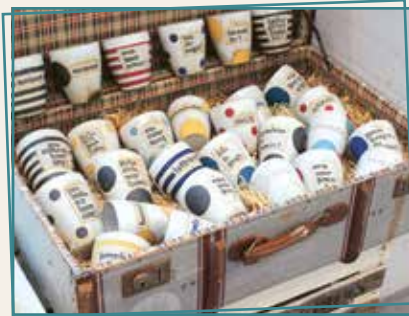
Handgefertigte Keramik für jeden Anlass (Keramikwerkstatt Christine Adam)

Man darf daher wieder gespannt sein, was uns die professionellen und ambitionierten nebenberuflichen Kunsthandwerker in diesem Jahr an neuen Ideen und Trends präsentieren werden. Ob Keramik, Glaskunst, Metallfiguren und Dekoratives für Haus und Garten, oder einfach nur Schmückendes für jeden Geschmack. Mit indi-