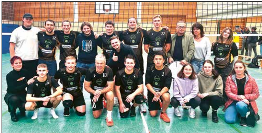
Gute Stimmung trotz der 1:3-Niederlage im Spitzenspiel gegen BG Marburg herrschte bei der Mannschaft und den Fans.

Am Ende konnten die Rauschenberger dem schnellen und variablen Spiel der Marburger nichts mehr entgegensetzen. Vor allem aber auch, weil der am Vortag noch in der Bezirksoberliga zum Einsatz gekommene Diagonal- und Hauptangreifer der Marburger nicht mehr in den Griff zu bekommen war. Danke sagen die Spieler einmal mehr ihren Fans, die auch diesmal nicht nur zahlreich, sondern auch gewohnt lautstark – auch mit Trommeln – das Team unterstützten.