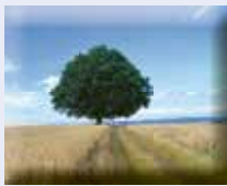
Heilige Eiche, ein Kraftort in Rauschenberg, M.-L. Schmerberg, 2023