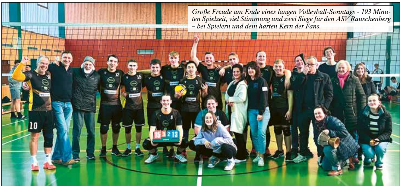
Große Freude am Ende eines langen Volleyball-Sonntags - 193 Minuten Spielzeit, viel Stimmung und zwei Siege für den ASV Rauschenberg – bei Spielern und dem harten Kern der Fans.

Unter der Telefonnummer 0800 / 00 22 8 33 (kostenfrei aus dem Festnetz) oder unter der Telefonnummer 22 8 33 (Handy max. 69 ct./min) besteht zudem die Möglichkeit weitere Notdienstapotheken im Umkreis abzufragen.