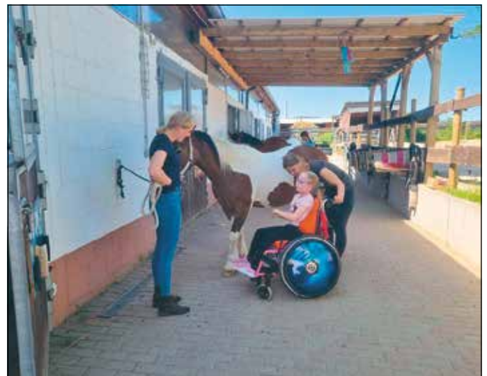
Ein Einblick in den inklusiven Teil der Arbeit des Vereines.

Das Hauptaugenmerk liegt dabei nicht auf dem sportlichen Reiten, sondern vielmehr auf dem Kontakt zum Tier in unterschiedlichsten Angeboten. „Um dieses Ziel zu erreichen, werden 15 eigene Pferde für den Verein im Offenstall stehen“, beschreibt Methfessel das Konzept.