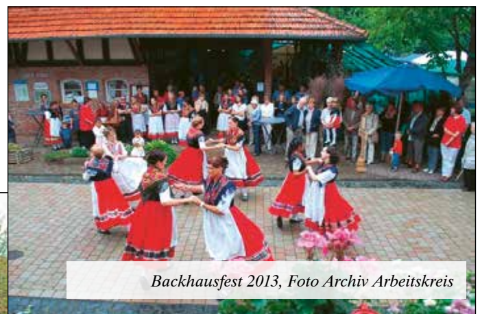
Backhausfest 2013

AK ARBEITSKREIS FÜR HUGENOTTEN- UND WALDENSERGESCHICHTE SCHWABENDORF E.V.