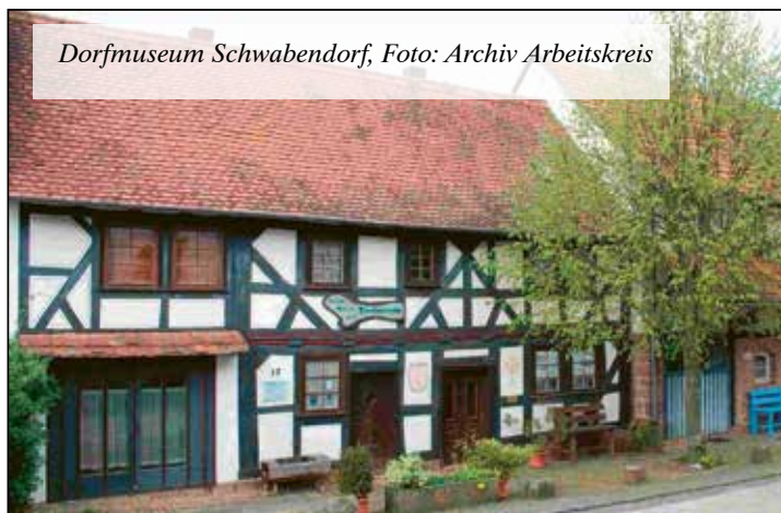
Dorf museum Schwabendorf