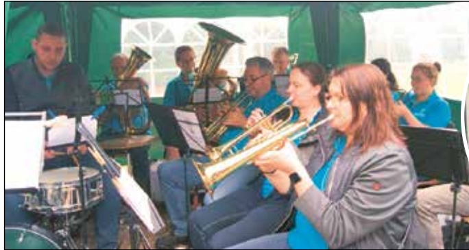
Alles Gute zum Geburtstag!

Am Samstag, dem 06.07.2024 wurde das Fest zum 40-jährigen Bestehen des Dorfmuseum Schwabendorf, dem „Daniel-Martin-Hauses“, mit einem Geburtstagsständchen des Posaunenchores Schwabendorf feierlich eröffnet. Wie schon 1984 bei der Eröffnung präsentierte der Chor einen unterhaltsamen musikalischen Rahmen, bei dem sich Schwabendorfer und Gäste aus anderen Hugenotten- und Waldensergemeinden an dem schönen Sommerabend zum „Fest unter der Platane“ wohlfühlten. Alles, was ein schönes Fest braucht, war dabei. Nette Menschen aus nah und fern, gute