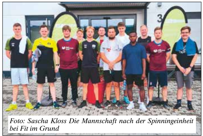
Die Mannschaft nach der Spinningeinheit bei Fit im Grund