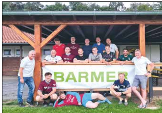
Mannschaftsfoto nach dem BARMER Body Check

Am Montag traf sich die Mannschaft und absolvierte einen Body Check in Kooperation mit Vereinsticket.de. Die Analyse umfasste verschiedene Parameter wie beispielsweise den Gesamtkörperfettanteil und den Viszeralanteil im Körper. Unter sachkundiger Leitung der BARMER bekam jeder Spieler unserer Ersten Mannschaft seine Werte persönlich erläutert.