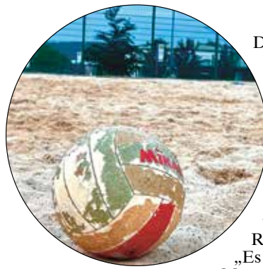
Hat nunmehr ausgedient: einer der alten Beachbälle des ASV Rauschenberg.

Die Scheine wurden größtenteils im REWE-Markt in Rauschenberg gesammelt, wo die Kunden die Möglichkeit hatten, ihre Einkäufe für den guten Zweck einzusetzen. Stefan Koch, der sich leidenschaftlich für die Förderung des Sports in Rauschenberg engagiert, zeigte sich erfreut über die rege Teilnahme der REWE-Kunden an der Aktion: „Es ist fantastisch zu sehen, wie viele Menschen bereit sind, ihren Verein zu unterstützen.“