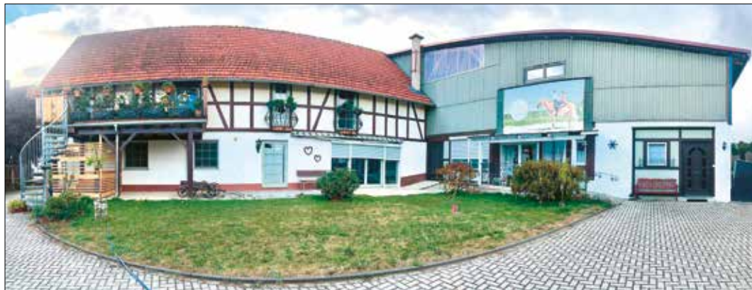
Lädt nicht nur zum Reiten, sondern auch zum Verweilen ein: die Anlage in der Rauschenberger Bahnhofstraße.

Mehr Informationen zu „Bewegt mit Pferd“ finden Sie unter