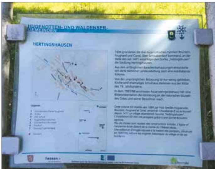
„Info-Tafel an der Bushaltestelle-Hertingshausen“

Treffpunkt ist um 9.30 Uhr vor dem Dorfmuseum, dem „Daniel-Martin- Haus“, in Schwabendorf. In Fahrgemeinschaften fahren wir zur Hugenottenkolonie Hertingshausen.