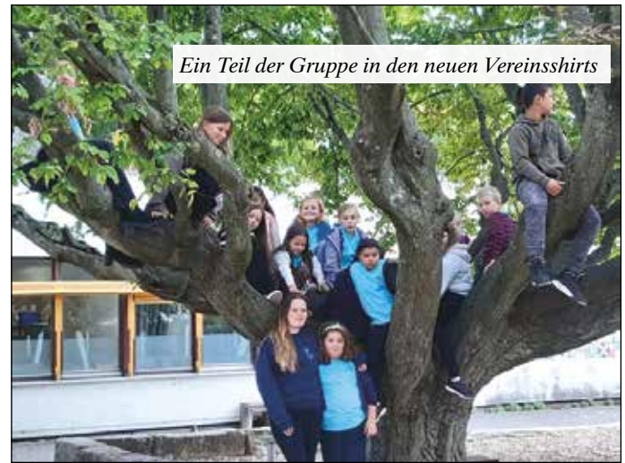
Ein Teil der Gruppe in den neuen Vereinsshirts

Wir trafen uns um kurz vor 7 Uhr und die Nervosität der Kinder stieg trotz Müdigkeit sichtbar an. Für einige Kinder war es das erste LKTT und die Erwartungen dementsprechend hoch. Nach dem turbulenten Start (technische Probleme beim Bus) war die Fahrt zum Georg-Büchner-Gymnasium in Bad Vilbel unser Ziel – unsere Unterkunft für die Nacht. Das Klassenzimmer wurde zügig bezogen und die Umgebung erkundet. Nach einer gemeinsamen Übungsstunde und dem Mittagessen, fand um 13:00 Uhr auf dem Platz vor der Vilco die Eröffnungsveranstaltung statt. Direkt im Anschluss nahmen alle Kindertrachten- und Folklore-Gruppen