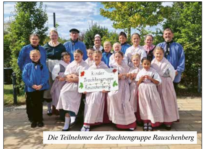
Die Teilnehmer der Trachtengruppe Rauschenberg

Der nächste Auftritt der Kindertrachtengruppe findet am 16.10.2024 beim Scheunen-Café statt.