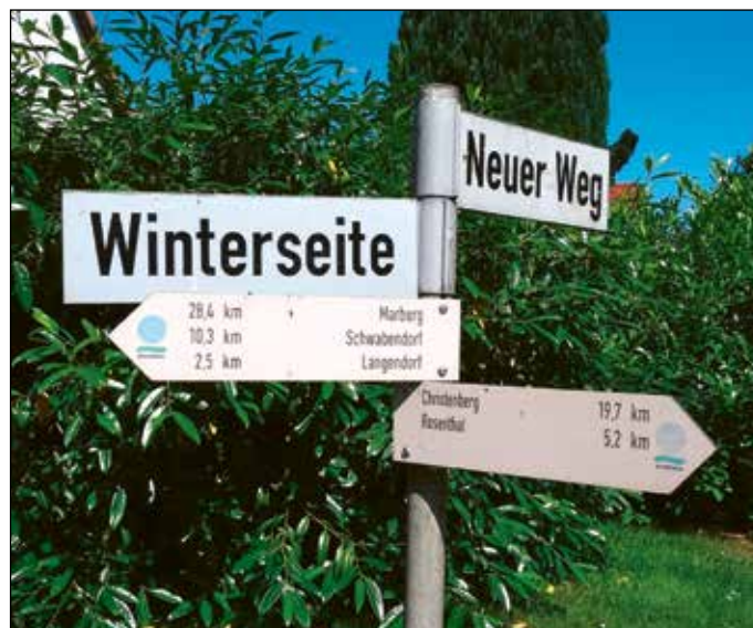
„Wegweiser von Hertingshausen nach Schwabendorf“

Marion Badouin-Fries