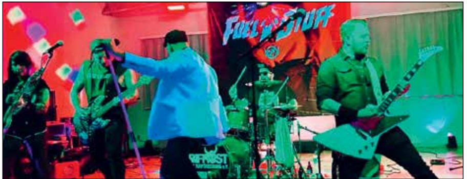
Foto: Die Band Fuel'n'Stuff beim Rockabend im April 2024

Save the Date: Am Samstag, 22.03.2025, wird wieder gerockt in der Kratz'schen Scheune in Rauschenberg: "Rausch'n'berg - Rockabend mit Live-Musik" geht in die zweite Runde. Der Verein Bifröst Kulturförderung e.V. sowie alle Beteiligten des Erntedrunkefestes freuen sich darauf, wieder mit Euch zu feiern. Weitere Infos folgen.