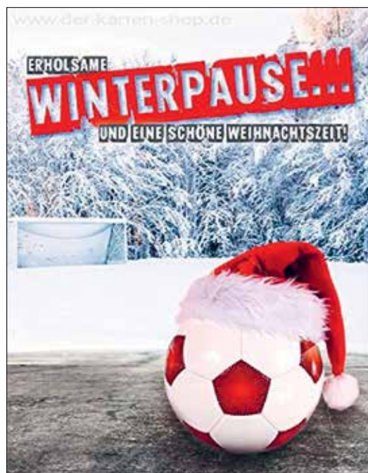
TSV Ernsthausen - Die Fußballabteilung Bericht u. Bilder: Larry Kuhnle