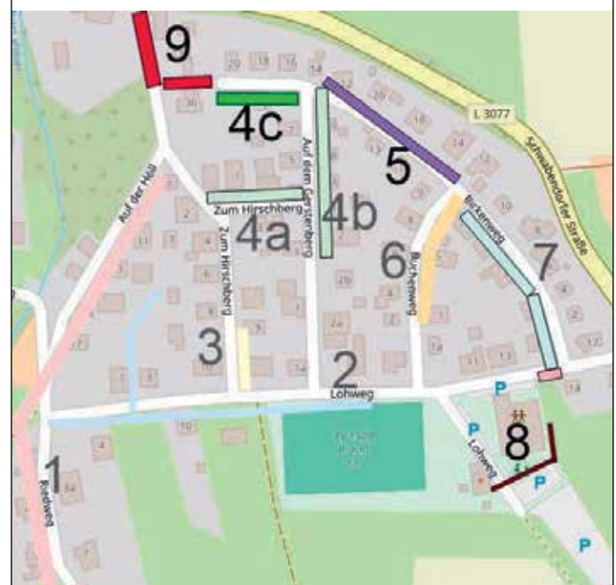
Der Arbeitskreis Solarwärme Bracht - Ralph Vogt