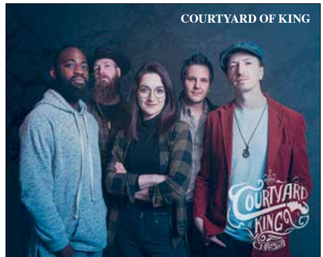
COURTYARD OF KING