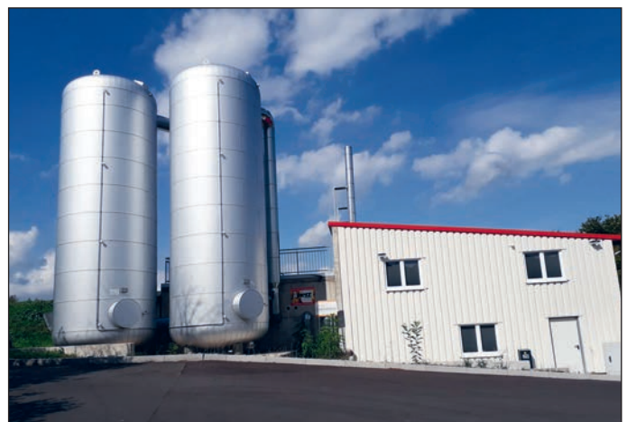
Das moderne Holzhackschnittel-Heizwerk in der Kernstadt