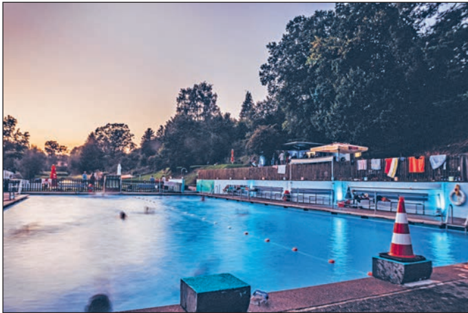
Badespaß mit tollem Ambiente im Freibad Rauschenberg

Bei verlängerter Badezeit, trug die Beleuchtung rund um das Becken zu einer tollen Atmosphäre bei.