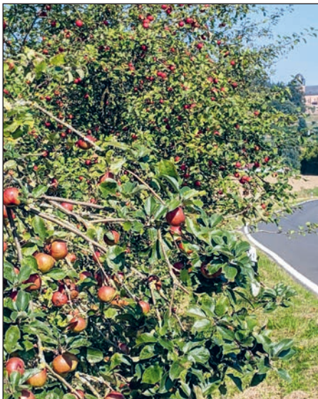
Apfelbäume an der Himmelsberger Straße

paar Äpfel holen dürfen. Die Betonung liegt auf ein paar und bitte erst Ende September. Die oben genannten Sorten haben in diesem Jahr kleine Früchte, sie stehen ca. 600 m vom Ortsausgang entfernt, dort, wo die Straße langsam ansteigt.