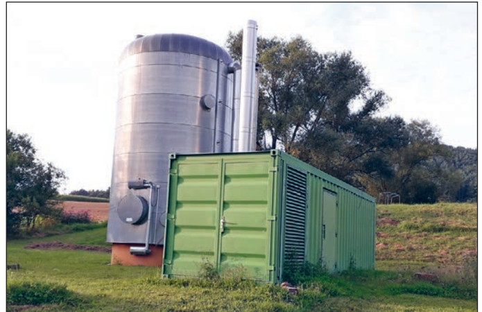
Übergabestation mit Spitzenlastkessel und Pufferspeicher der Nahwärme-Genossenschaft in Josbach

Sehr wohl fühlt er sich bei dem Gedanken, nicht von einem der großen Energieversorger oder der Preisentwicklung auf dem Ölmarkt abhängig zu sein: „Als Mitglied der Nahwärme in Josbach habe ich bei wichtigen Entscheidungen stets ein Mitspracherecht“.