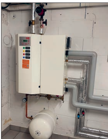
Platzsparend: Eine Hausübergabestation (HUS) der Nahwärme Rauschenberg.

Mit rund 40 Hausanschlüssen betreibt die Nahwärme Josbach das kleinste der drei Wärmenetze und ist mit dem Gründungsjahr 2010 zugleich die älteste der Rauschenberger Nahwärme-Genossenschaften. Von der damals in Josbach geleisteten Pionierarbeit und den dabei gesammelten Erfahrungen konnten später auch die anderen Genossenschaften profitieren.