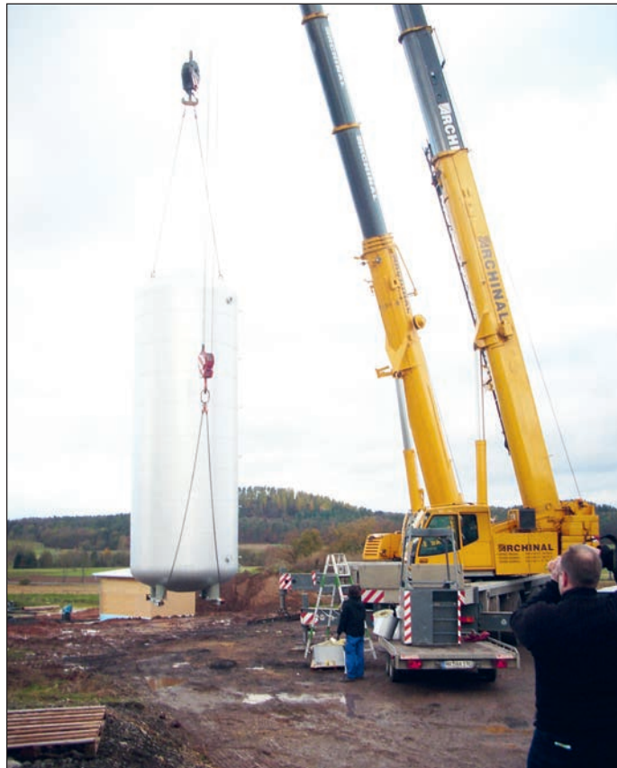
Spektakulär: Das Aufstellen des Warmwasserspeichers für das Schwabendorfer Wärmenetz.

In der Kernstadt befindet sich die Nahwärme Rauschenberg eG inzwischen im siebten Jahr ihres Bestehens. Mit mehr als 15 Kilometern verlegten Nahwärmeleitungen, einem modernen Hackschnitzel-Heizwerk und einem Spitzenlastkessel betreut die Nahwärme Rauschenberg als größte unter den Rauschenberger Nahwärmegenossenschaften aktuell 209 Mitglieder, die mehr als 220 Immobilien an das Nahwärmenetz angeschlossen haben. Allein im Jahr 2020 konnten somit ca. 650.000 Liter Heizöl in Rauschenberg eingespart werden.