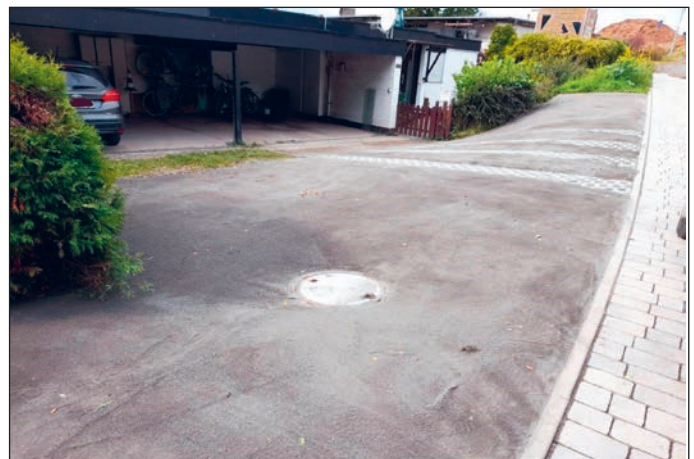
Grundstückseinfahrt und Parkfläche am Schwitzenberg nach Abschluss der Arbeiten

Ein anderer Einsatz führte die Mitarbeiter des Bauhofs zur Grundstückseinfahrt eines Anliegers am Schwitzenberg in der Kernstadt. Dort war im Zuge des Straßenbaues für das Neubaugebiet die Fahrbahn um etwa 15 Zentimeter angehoben worden. Dadurch wurde die Befahrbarkeit der überwiegend im städtischen Bereich liegenden – zuvor mit Frostschutz aufgebauten – Grundstückseinfahrt aus Sicht des Anliegers beeinträchtigt. Außerdem wurde eine auf städtischer Fläche von der Baufirma mit Frostschutz hergestellte zusätzliche Parkmöglichkeit als nicht fachgerecht bemängelt.