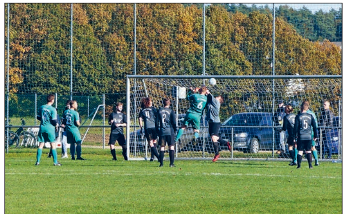
völlig allein gelassen aber gehalten