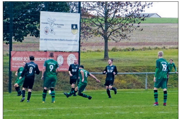
Drei gegen Vier im eigenen 16er